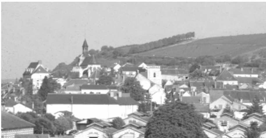
Le Belvédère sur la crête de la Côte Saint- Jacques domine Joigny